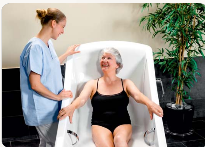
Komfortabler Innenraum mit viel Platz im Schulter- und Gesäßbereich

Die ergonomische Innenform und der häusliche Charakter der Wannenform bieten insgesamt einen beschützenden Charakter für den Badenden und erhöhen dadurch deutlich das Wohlbefinden.