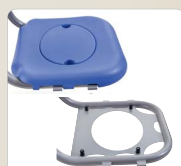
11 Die PUR-Auflage wird einfach auf den Edelstahlrahmen aufgeschoben und ist jederzeit abnehmbar.