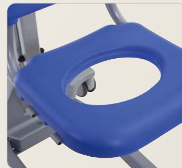
7 Sitzfläche mit großer, verschließbarer Pflegeöffnung.