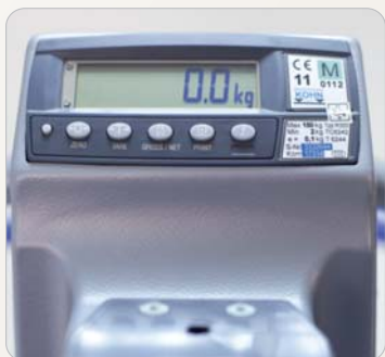
5 Optional: Digitale Patientenwaage, geeicht.