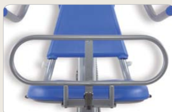
8 Optional: In die Halterung am Sitz einsteckbares Seitengitter mit Sicherheitsverschluss.