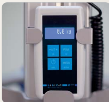
6 Optional: Digitale Patientenwaage, nicht geeicht.