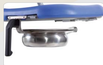
9 Optional: Halter für Steckbecken zur Aufnahme Ihres hauseigenen Steckbeckens.