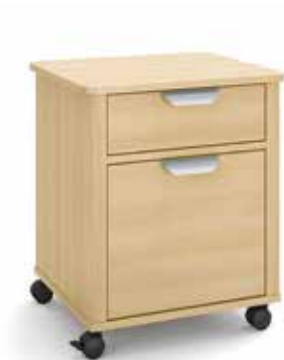
Die Griffschalen aus Aluminium 1) geben den Nachttischfamilien vivo und vitalia ein unverwechselbares Design und erlauben auch vom Bett aus einen ergonomischen Zugriff.