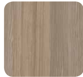
Pinie Suomi grau (R55022)