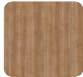
Kirsche Havanna (R42006)