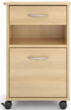
vt Bewährter Klassiker Seite 10-11