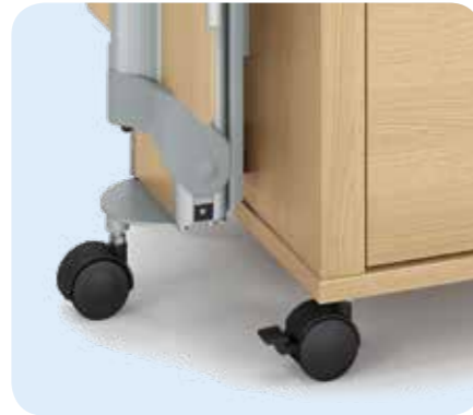
Die 5. Rolle an der Mechanik und die kompakte Konstruktion sorgen für eine außergewöhnliche Stabilität, Kippsicherheit sowie eine Belastbarkeit der Bettischplatte bis 20 kg.