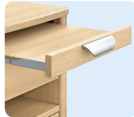
Das Tablett kann im ausgezogenen Zustand sicher arretiert werden, somit wird ein versehentliches Schließen des Auszugs verhindert.

Dank der dreiseitig geschlossenen Ausführung 2) ist kein Durchschieben der Schubladen zur Wand möglich