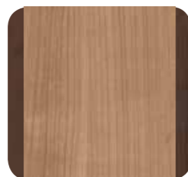
Korpus Kirsche Havanna Umrandung Cacao