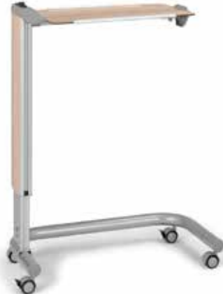
Server Flexible Mobilität Seite 12-13