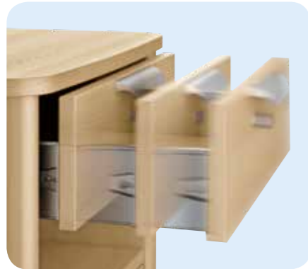
Der standardmäßig eingesetzte Softeinzug 1) verringert die Klemmgefahr und die Geräusche beim Schließen der Schubladen.

Der in Deutschland etablierte Expertenstandard „Sturzprophylaxe“ hat es sich zum Ziel gesetzt, Stürze und Sturzfolgen zu vermeiden, indem Risiken und Gefahren erkannt und möglichst minimiert werden. Einen wertvollen Beitrag zur Reduzierung des Sturzrisikos stellt die durchgehende Verwendung von Schubladen statt Türen an den Nachttischmodellen dar. Der Zugriff aus dem Bett wird erleichtert und zugleich die Gefahr eines Sturzes minimiert. Spezielle Modelle bieten auch für Niedrigpflegebetten einen optimalen Zugriff zum Nachttisch. Die Schubladen sind werkzeu- los entnehmbar und somit sehr einfach zu reinigen.