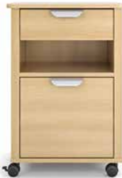
vitalia Robuste Geradlinigkeit Seite 8-9