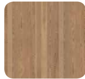
Cottage Pinie (R55023)