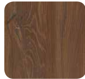
Akazie dunkel (R38006)