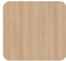
Lindberg Eiche (R20021)