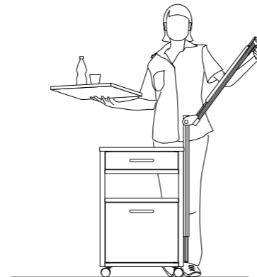
Die seitlich angebrachte Bettischplatte lässt sich durch Einhandbedienung leicht ausziehen, ohne dass die Pflegekraft das Esstablett abstellen muss.