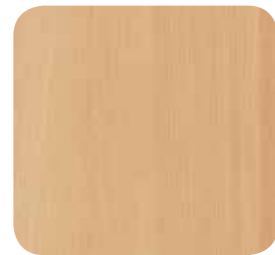
Buche natur (R24015)