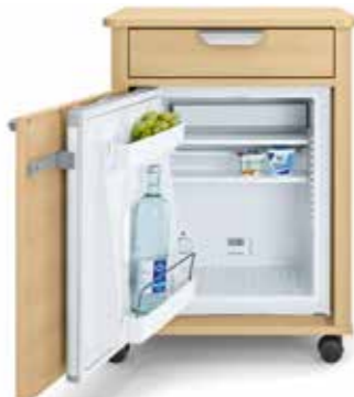
Die Modelle mit Kühlschrank verfügen über ein geräumiges 41 l Fassungsvermögen und eignen sich somit auch für große Flaschen.