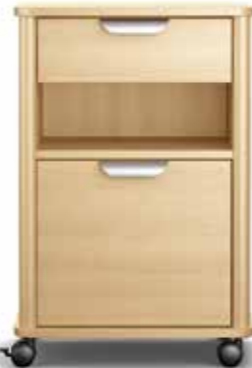
vivo Design trifft Funktionalität Seite 6-7