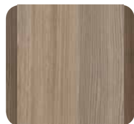
Korpus Pinie Suomi grau Umrandung Pinie Suomi braun