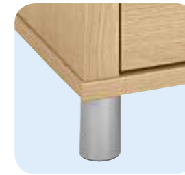
Füße statt Rollen