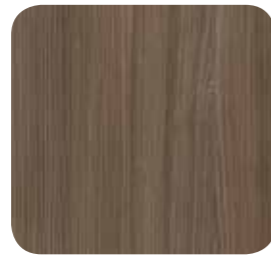
Pinie Suomi braun (R55021)