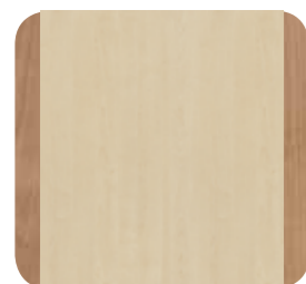
Korpus Lundbirke Umrandung Kirsche Havanna